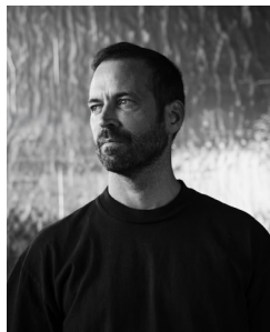
BENJAMIN MILLEPIED DIRECTEUR ARTISTIQUE